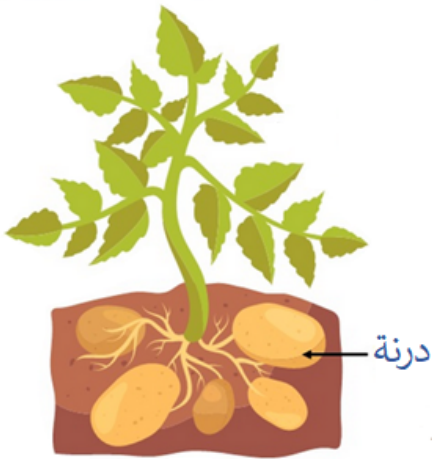
▲ نبات مكتمل