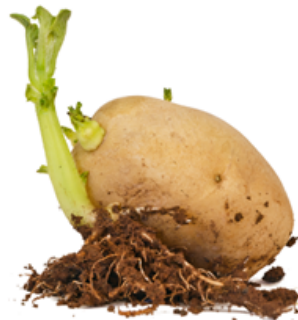
▲ نمو البرعم