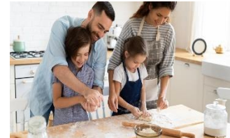
التعاون بين أفراد الأسرة