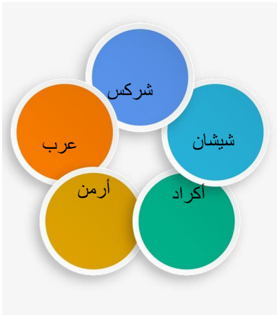
الفئات المساهمة في بناء الأردن