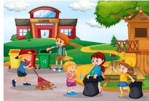
التعاون في المدرسة