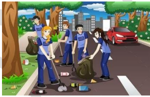
التعاون بين أفراد المجتمع